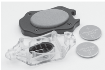
Deux piles CR1616 Côté positif vers le (+) haut